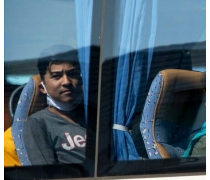
Alman Kamuoyunda Sığınmacı Tartışmaları